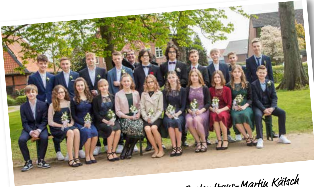
Konfirmation Pfarrbezirk II, 23.4., Pastor Haus-Martini Kätsch