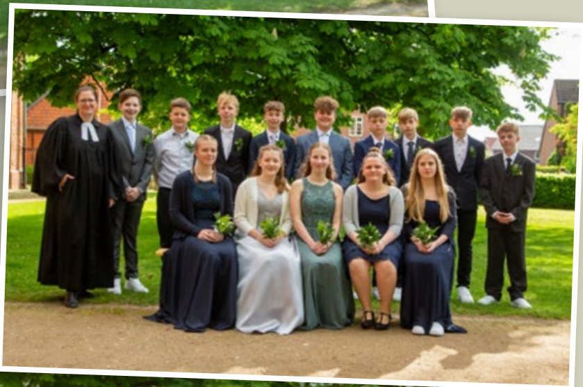
Pfarrbezirk I 05.05.2024 Pastorin Uhr