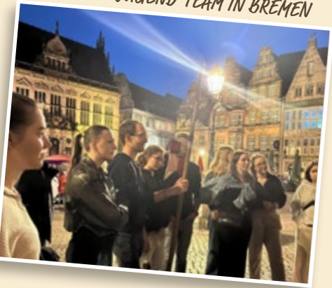
JUGEND-TEAM IN BREMEN