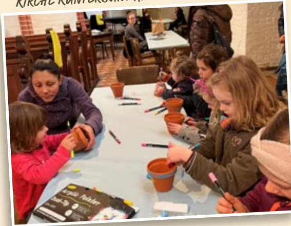
KIRCHE KUNTERBUNT AN OSTERN