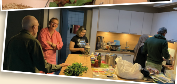
KONFI ÜBERNACHTUNG IM DOM